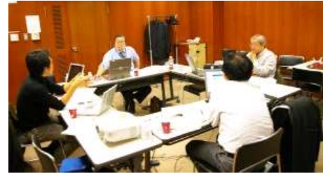
ブログ講座の様子